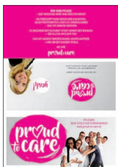
Titel-, Klapp- und Rückseite

Die Flyer zur Initiative können Sie an Mitarbeiter, Bewohner, Patienten und Partner verteilen und in Ihrer Lobby auslegen.